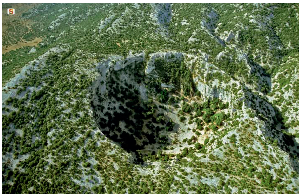
Figura 1.2 Dolina di Sercone o Selhone o Suercone